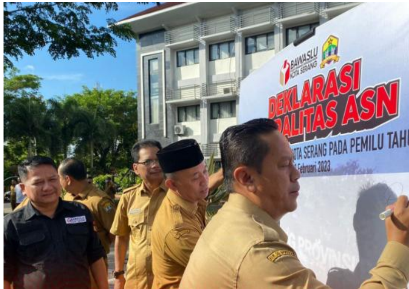
Gambar 1. (Deklarasi Netralitas ASN di Lingkungan Pemerintah Kota Serang)

Integritas dalam pelaksanaan program pencegahan pelanggaran netralitas ASN oleh Bawaslu Kota Serang tercermin melalui komitmen, profesionalitas, dan kepatuhan terhadap ketentuan yang berlaku. Komitmen netralitas diwujudkan melalui Deklarasi Netralitas bersama ASN Pemerintah Kota Serang sebagai bentuk kesadaran menjaga profesionalisme. Meskipun terbatas SDM, pelaksana program tetap bertanggung jawab dengan memaksimalkan potensi seluruh anggota. Tindak lanjut terhadap pelanggaran juga dilakukan sesuai prosedur melalui koordinasi dengan BKPSDM dan/atau rekomendasi kepada KASN. Selain itu, Bawaslu menunjukkan sikap adaptif dengan menyiapkan video seruan netralitas sebagai alternatif ketika partisipasi ASN rendah, menunjukkan bahwa integritas telah menjadi budaya kerja dalam pelaksanaan program pencegahan.